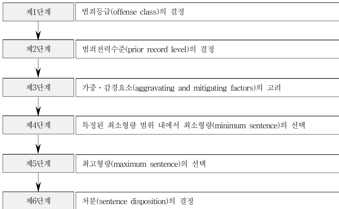
<그림 1> 중죄에 대한 양형절차